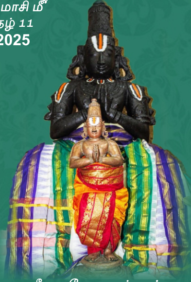
ஸ்ரீ குலசேகர ஆழ்வார்