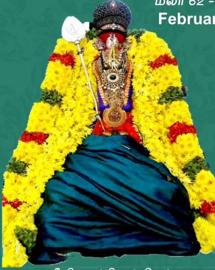
ஸ்ரீ திருகச்சி நம்பிகள்

குரோதி ன்ரு - மாசி மீ மலர் 62 - இதழ் 11 February 2025