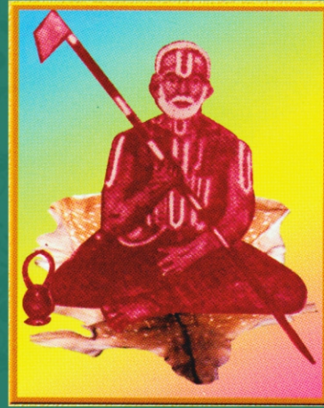
ஸ்ரீ காடந்தேத்தி ஆண்டவன்